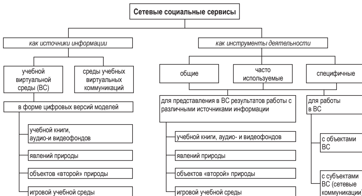
Рисунок 3. Сетевые социальные сервисы как источники информации и как инструменты учебно-познавательной деятельности школьников